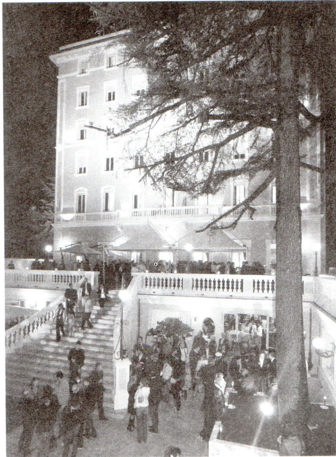
Intorno dell'inaugurazione. La grotta, la sala e l'ingresso dell'Hotel Helvetia.

della chi- Una rap- enza spe- nenti come che inare ovuti